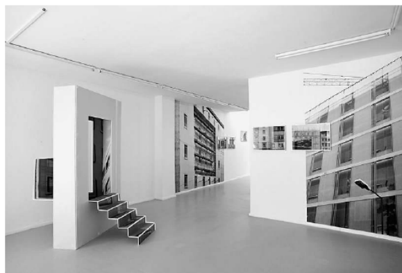
„Agenten und Streber“, Raumsicht Zweigstelle Berlin, 2010

Abwrackprämiensobjekte, das in ein Kino verwandelt wurde. Welches Konzert oder welchen Klub in Berlin können Sie/kannst du empfehlen? Haus 13, am Pfefferberg. Welche Zeitschrift/welches Magazin und welches Buch begleitet Sie/dich zurzeit durch den Alltag? „Der Untergang der Titanic“ von Hans Magnus Enzensberger und „Die Leiden eines Amerikaners“ von Siri Hustvedt. Welcher Gegenstand/welches Ereignis des Alltags macht Ihnen/dir am meisten Freude? Kletterkarabiner (hoch hinauf) und Kochlöffel (rundherum).