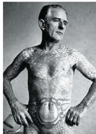
■ Bis 24. 4., Di.–Sa., 11–18 Uhr Lindenstr. 35. Eröffnung 19. 3., 18 Uhr

Anlässlich des 90. Geburtstags des Großmeisters der Tätowierkunst, Herbert Hoffmann , präsentiert die Galerie Gebr. Lehmann eine Schau mit 45 Fotografien. Unter dem Titel „St. Pauli Souvenirs“ werden seine Porträts aus den 50er- und 60er-Jahren gezeigt, die er auf Reisen durch Deutschland und in seiner 1961 gegründeten „ältesten Tätowierstube Deutschlands“ in Hamburg aufnahm. Hoffmann gilt als Pionier der heutigen Tattooszene, der sich nach dem Krieg für die Entigmatisierung der Tattookultur einsetzte, da Tattooträger im Dritten Reich als Bolschewisten und Verbrecher verfolgt wurden. GO