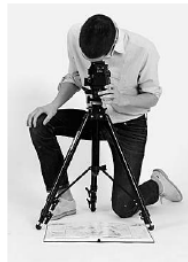
■ Bis 26. 4., Do.–Sa., 12–18 Uhr, Schröderstr. 13

Wenn ein Fotograf eine Fotografie ausstellt, auf der ein Fotograf zu sehen ist, der gerade fotografiert, dann hat man es höchstwahrscheinlich mit einem Fall von selbstreflexiver Besspiegelung des eigenen Mediums zu tun. Natürlich hat man das – und hat damit aber noch längst nicht alles gesagt. Denn dieser Fotograf auf dieser Fotografie des Fotografen Heinz Peter Knes , die in seiner aktuellen Ausstellung in der Galerie für Moderne Fotografie zu sehen ist, fotografiert im neutralen Studioambiente einen Atlas. Die Welt – hier ist sie schon längst mehr als einmal repräsentiert. Und so einfach ist hier plötzlich nichts mehr. DM